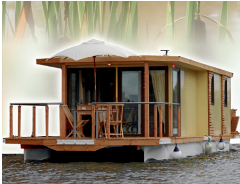
Hausboot SEADES 42 KA

Liebe Wassersportfreunde, Urlaubsfeeling am und auf dem Wasser - das ist das Thema, was uns gemeinsam treibt. Wie lässt sich Wassersport und Wohnkomfort bei allen Platz- und Preisrestriktionen verbinden und optimal umsetzen. Die Ideen unserer Kunden beflügeln uns dabei. Ob es ein schwimmendes Seehotel ist oder Hausboote zum Verchartern mit Kaminofen und Echtsteinwand, welches wir Ihnen in diesem Newsletter vorstellen möchten. Gerne können Sie dieses Boot und Urlaubsangebot auf der Messe MAGDEBOOT 2010 vom 12. bis 14. März in Magdeburg besichtigen.